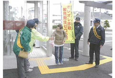
12/14 静岡銀行松崎支店、1/15 マックスバリュ松崎店で特殊詐欺被害防止広報を実施