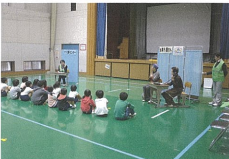
11/19 大賀茂小学校の防犯教室で不審者対応の寸劇を実施