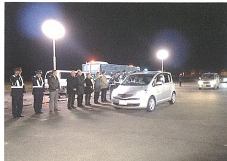
12/14 年末特別警戒出発式で青色防犯パトロールを実施