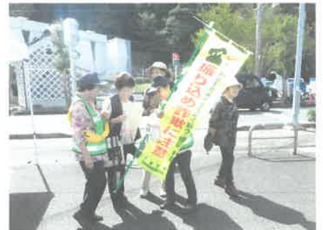
9/22 松崎町の長八まつり会場にて詐欺防止キャンペーンを実施