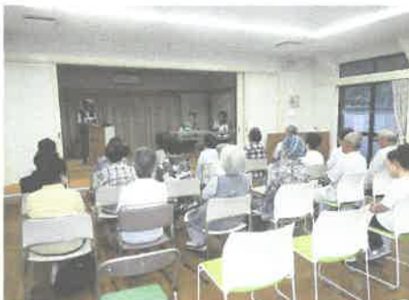
8/30 女性部の皆様と老人会で詐欺被害防止の寸劇を実施