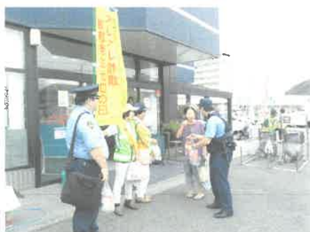
9/13 女性部の皆様と詐欺防止キャンペーンを実施